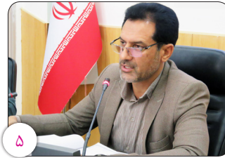
کمیته امداد، کرمانی‌ها را به شرکت در طرح نذر قربانی فراخواند