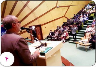
تشکیل شورای اداری شهرستان بم با حضور استاندار کرمان توسعه حرف اول را در بم می‌زند