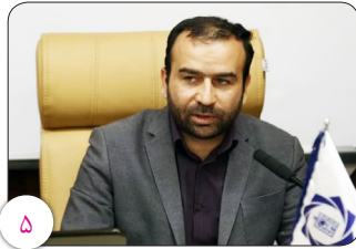
شهردار کرمان تأکید کرد: ضرورت استفاده از تجربیات کلان‌شهرهای موفق در حوزه سرمایه‌گذاری