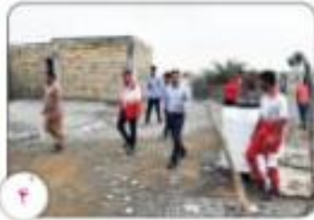
آماده باش تیم های هلال احمر کرمان