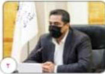
عوارض و حقوق وصولی از کارخانه فولاد سیرجان ایرانیان بین تکار و بر دسیر تقسیم می شود