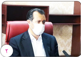
مدیرکل امور اقتصادی و دارایی استان کرمان: نظارت های درونی و سیستمی از مهم ترین ابزارهای نظارت هستند

چهارشنبه ۲۲ تیر ماه ۱۴۰۱ / ۱۳ ذی الحجه ۱۴۴۳ / ۱۳ جولای ۲۰۲۲ ۸ صفحه ای - سال یازدهم شماره ۱۵۶۵ تک شماره ۲۰۰۰ تومان