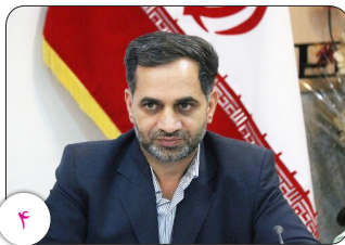
دادستان کرمان اعلام کرد: صدور دستور فروش ۵۱۵۱ قلم کالا املاک تملیکی در کرمان